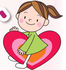
マスコットキャラクター ハートフルちゃん

秦野市社会福祉協議会は、秦野市にお住まいの方や福祉関係機関(高齢、障害、児童施設など)の参加と協力を得ながら活動をし、地域にあった事業を行っています。その事業の一部をご紹介します。