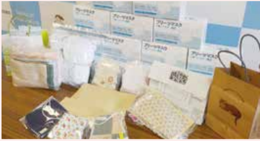
ご寄付いただいたマスク

新型コロナウイルス感染症の感染が拡大する今こそ私たちにできることに取り組みようと、地域のため、利用者さんのために戦っている人たちを応援するためのプロジェクトを立ち上げました。