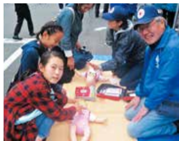
救命救急コーナー

平成30年11月3日(例)に開催された「市民の日」に参加し、ボラ連のPRを行いました!