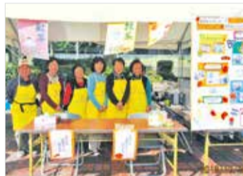
ともしび広場模擬店

平成30年10月20日(土)に開催された「第51回秦野市社会福祉大会」ともしび広場に模擬店として参加しました!