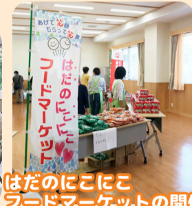
はだのにこここ フードマーケットの開催