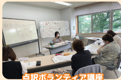
点訳ボランティア講座

地域住民等が行う福祉活動への支援、福祉活動を行う人材の発掘・育成、福祉教育・福祉活動への参加のしくみづくり等を行います。また、令和3年度より新たにスタートした地域の福祉活動のきっかけをつくり・広げる「一日一福キャンペーン」、食料支援や地域のベンチ作りの取組を今年度も引き続き行います。