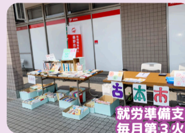
就労準備支援事業による 毎月第3火曜日古本市の開催