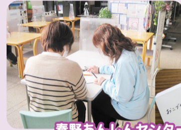
秦野あんしんセンター

今年度より預託金による死後事務等を行う「はだのエンディング応援事業」を本格始動していきます。