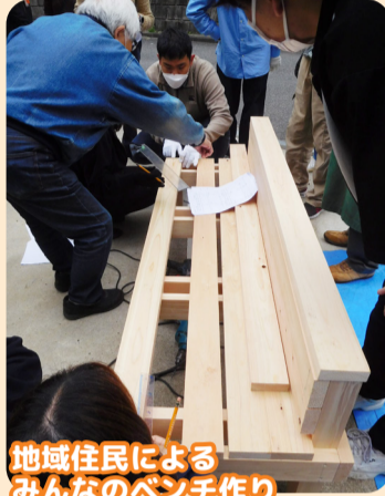
地域住民による みんなのベンチ作り

地域住民等が行う福祉活動への支援、福祉活動を行う人材の発掘・育成、福祉教育・福祉活動への参加のしくみづくり等を行います。また、令和3年度より新たにスタートした地域の福祉活動のきっかけをつくり・広げる「一日一福キャンペーン」、食料支援や地域のベンチ作りの取組を今年度も引き続き行います。