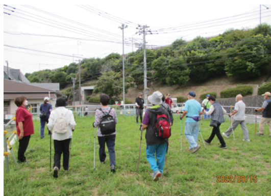
<ポールウォーキングの様子>