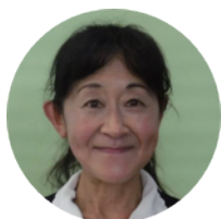
主任児童委員部長

私たちは、子どもたちの健やかな成長を願い、地域を巡り、研修を重ねて多くの情報を集め、問題解決の手助けに努めたいと思います。