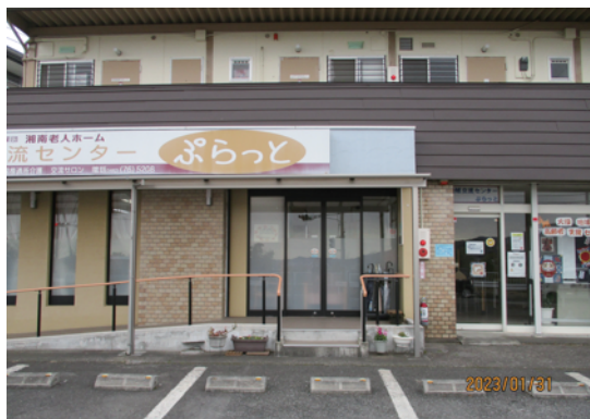
<地域交流センター ぷらっと>