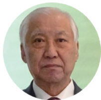
秦野市 民生委員児童委員協議会