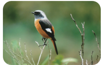
ジョウビタキ (弘法山)