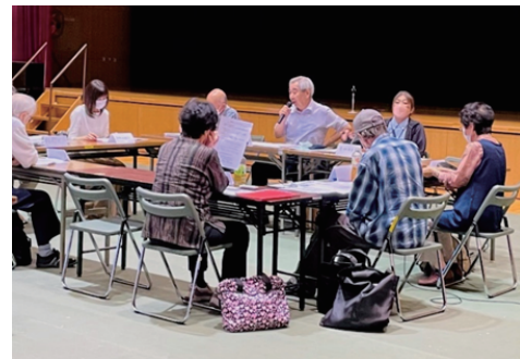
介護者の集いの様子