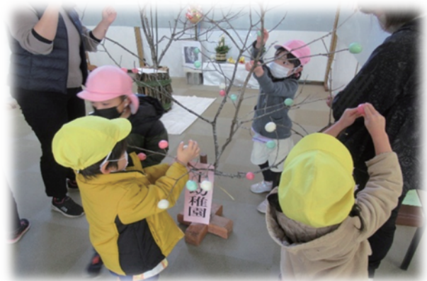
オンベ竹と団子飾り