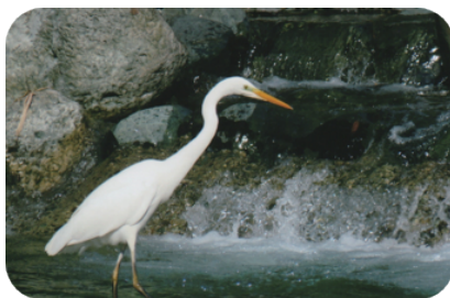
ダイサギ (四十八瀬川)