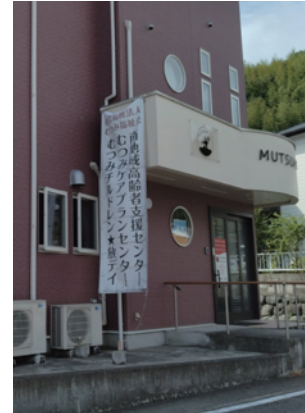
むつみケアセンター

また当センターでは、さわやか体操や囲碁サロンを実施しており、リピーターの方も多く地域の高齢者の交流や集いの場としても活用いただいています。地域高齢者支援センターを身近なものと感じていただき、今後も顔の見える関係づくりに努めていきます。