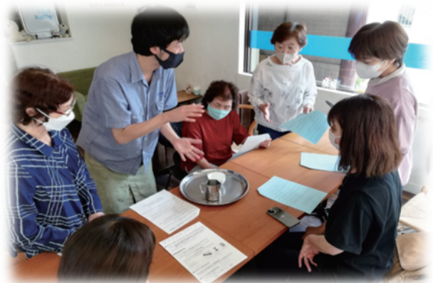
ラテアートで世代間交流