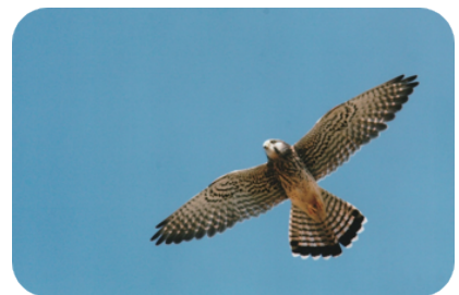
チョウゲンボウ (大根川)